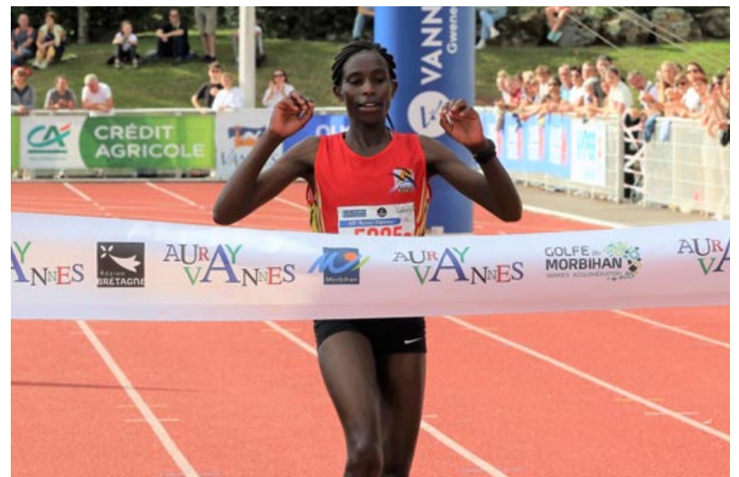
La Kényane Ruth Krania en 1 h 14' 53.

Un grand merci aux 600 bénévoles qui oeuvrent à l'organisation ainsi qu'à nos partenaires institutionnels ou économiques qui nous soutiennent. Sans eux, Auray-Vannes n'existerait pas. Les Comités des Fêtes de Pluneret - Le Bono - Baden - Le Moustoir-Arradon - Ploeren - Plougoumelen, l'US Arradon Athlétisme et Le Botquelen participent également activement à l'organisation.