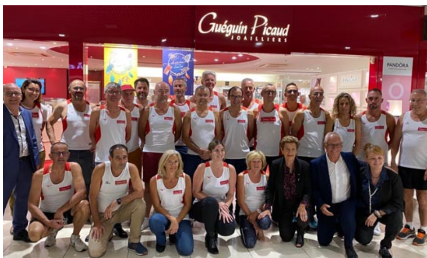
L'équipe Guéguin Picaud présente sur Auray-Vannes

Visitez notre nouvelle boutique en ligne www.gueguin-picaud.com www.maison-du-bijou.com